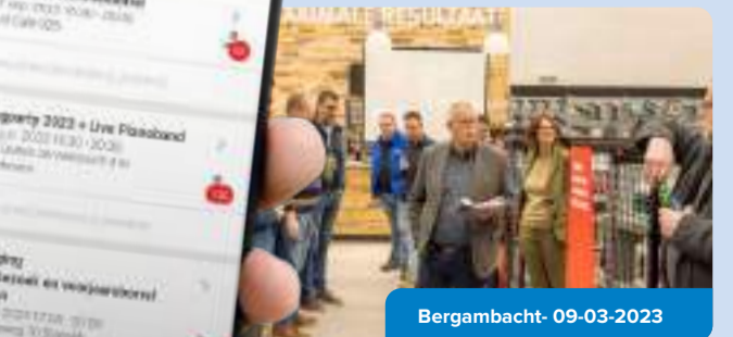
Bergambacht - 09-03-2023