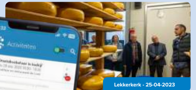
Lekkerkerk - 25-04-2023