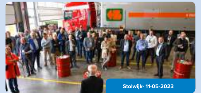
Stolwijk - 11-05-2023