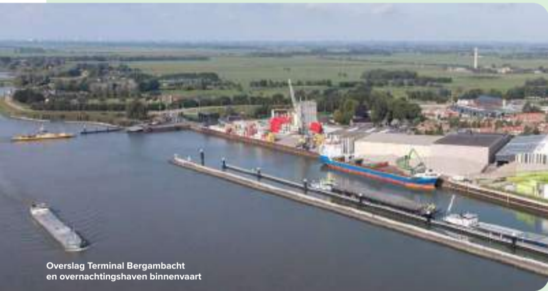
Overslag Terminal Bergambacht en overnachtingshaven binnenvaart

De laatste fase omvat het slopen van het oude veevoedergebouw en het uitvoeren van nieuwbouwplannen. Dit draagt bij aan de verbetering van de Lekdijk in Bergambacht en verzekert de industriële toekomst op die plek. Elkaar de hand geven en blijven praten werpt duidelijk zijn vruchten af.